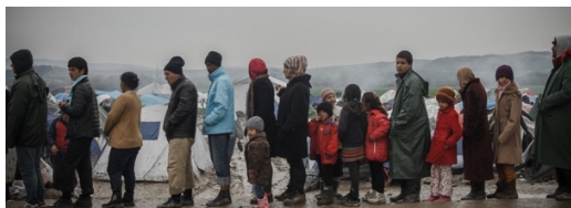
Journée mondiale des réfugiés

http://www.lecoeurouvert.net/pages/meditations/pratiques-juin/journee-mondiale-des-refugies.html