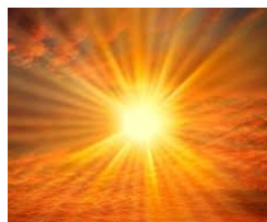
Solstice d'été 2025